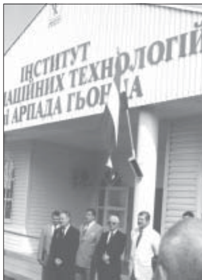
Бліц-інтерв'ю: ректор МАУП В. Бебик і міністр освіти і науки В. Кремень