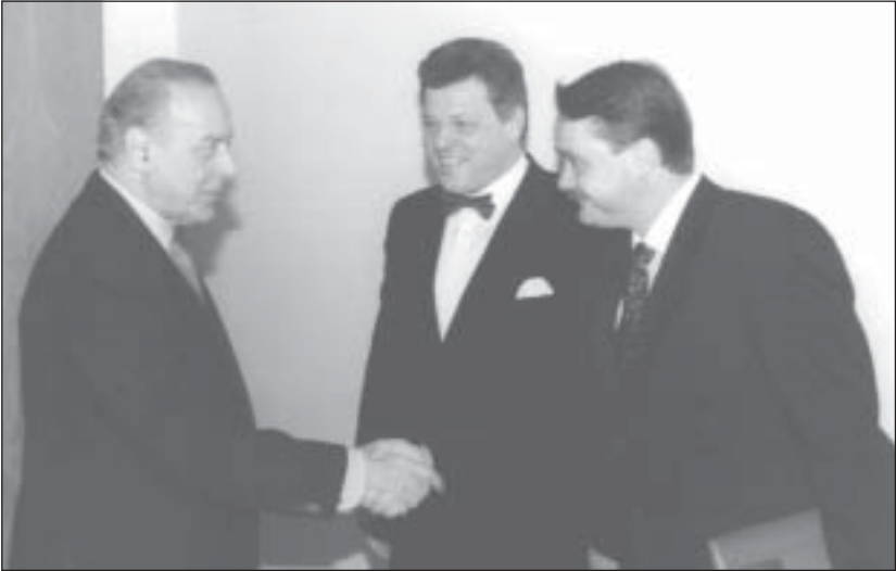
Президент Азербайджану Г. Алієв, президент МАУП Г. Щокін, ректор МАУП В. Бебик