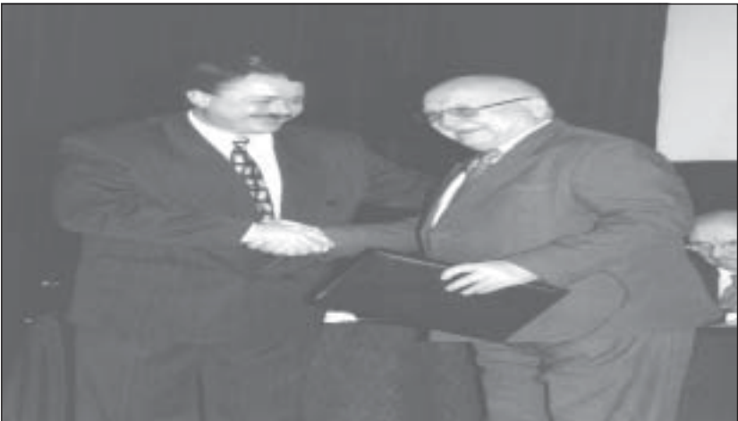
В. Ющенко: останній день роботи на посаді прем'єр-міністра України — перший день на посаді директора Українсько-російського інституту менеджменту і бізнесу ім. Б. Єльцина МАУП