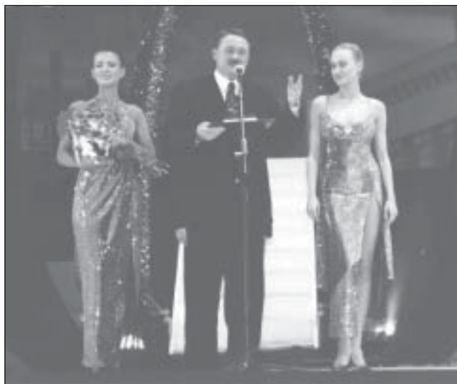
Красиві жінки іміджу не зашкодять...