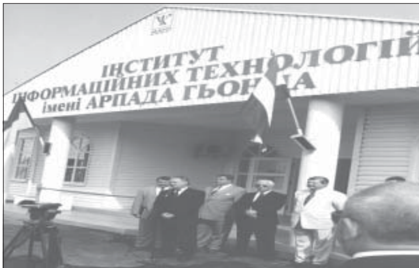
В залі засідань Кримського Уряду, м. Сімферополь